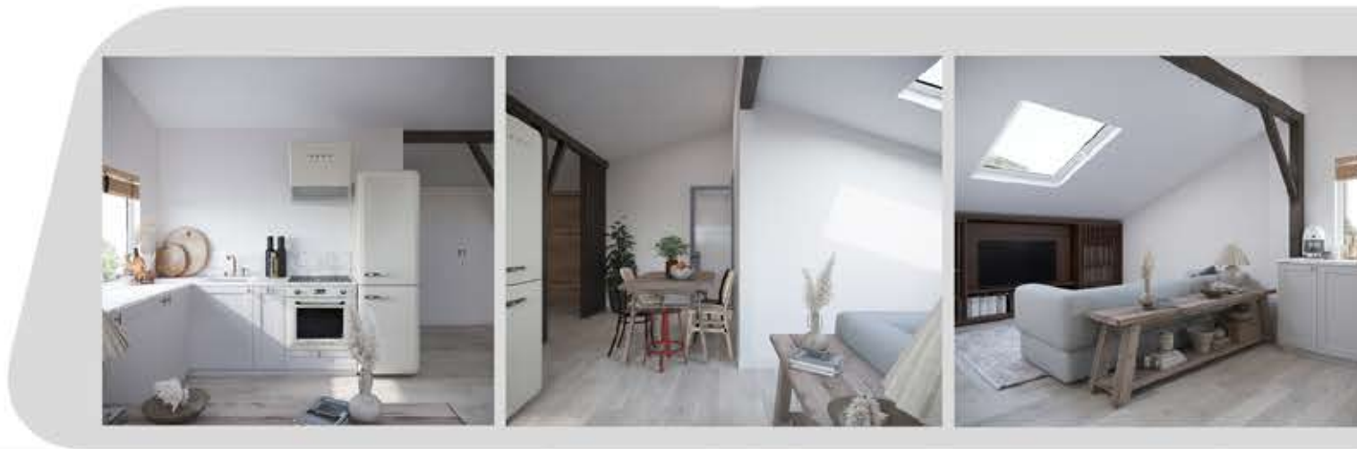
Prezentowane wizualizacje przedstawiają przykładowe wykończenie lokalu M13.