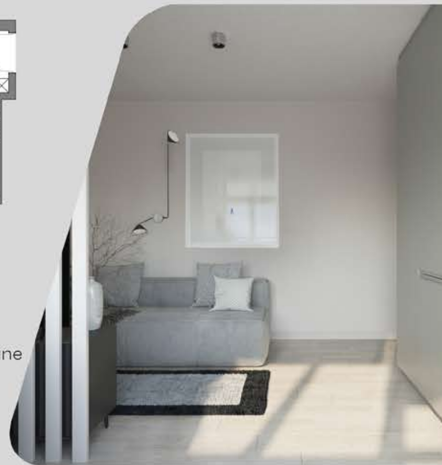
Prezentowane wizualizacje przedstawiają przykładowe wykończenie lokalu M7.

Skorzystaj z opcji wykończenia mieszkania pod klucz. Oferujemy mieszkania dopasowane do Twoich potrzeb.