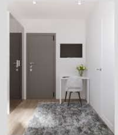
Prezentowane wizualizacje przedstawiają przykładowe wykończenie lokalu M13.