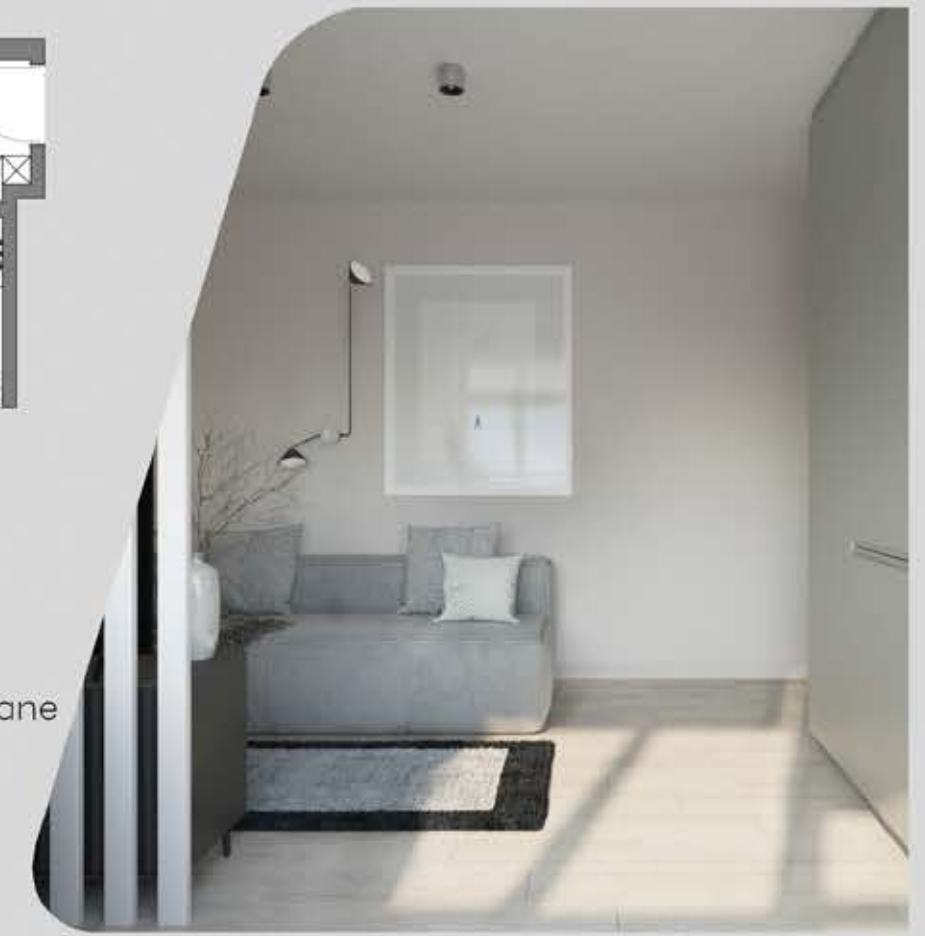
Prezentowane wizualizacje przedstawiają przykładowe wykończenie lokalu M7.

Skorzystaj z opcji wykończenia mieszkania pod klucz. Oferujemy mieszkania dopasowane do Twoich potrzeb.